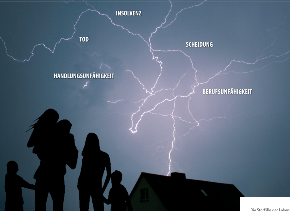
Die Störfälle des Lebens.